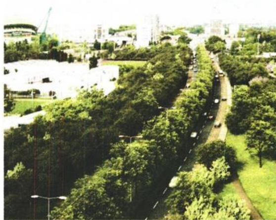
Segunda fase da obra só estará concluída no início de 2017, mas plantação dos freixos só acontece a seguir

A Ordem dos Engenheiros - que até deu um aval positivo ao projeto da 2.ª Circular - está agora menos confiante de que a gestão anunciada pela autarquia consiga evitar o caos no trânsito da capital. "Não nos opusemos à versão final do projeto, quando foi a discussão pública, porque esta contemplava algumas recomendações que ti-