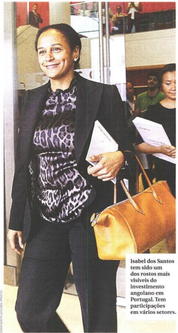
Isabel dos Santos tem sido um dos rostos mais visíveis do investimento angolano em Portugal. Tem participações em vários setores.

Nos últimos anos, Isabel dos Santos, filha do presidente angolano José Eduardo dos Santos, tem sido um dos exemplos mais para-