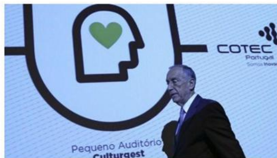
Marcelo Rebelo de Sousa.