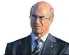
Carlos Matias Ramos Bastonário da Ordem dos Engenheiros

“Sem Engenharia Civil não se pode concretizar este plano [estratégico de infra-estruturas de transportes]”