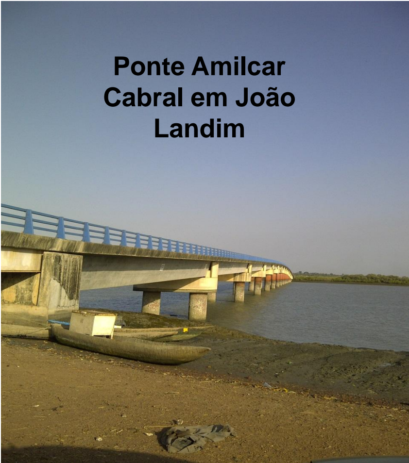
Ponte Amilcar Cabral em João Landim