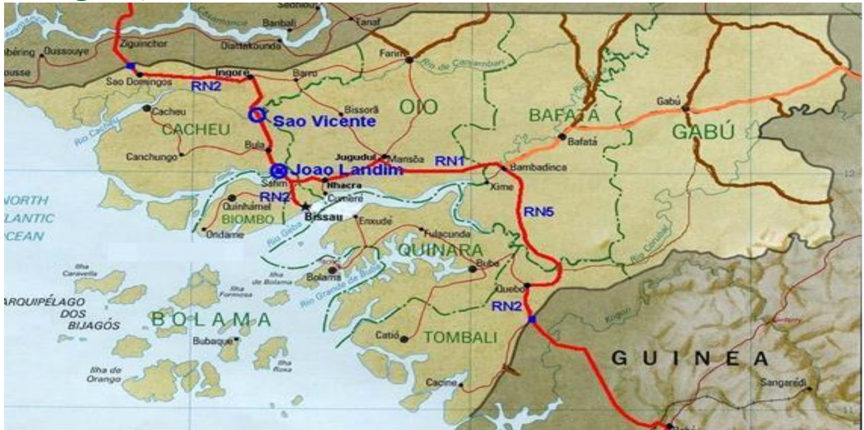
Fig. 4 Programa Especial Guiné Bissau (traçado castanho carregado)