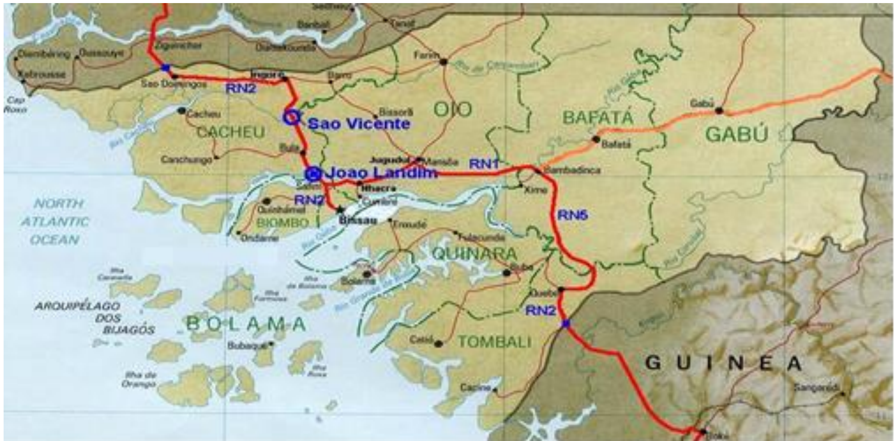
Fig. 3 – Traçado da Trans Oeste Africana na Guiné Bissau (traçado vermelho), derivação da Trans Oeste Africana (traçado laranja)