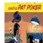
Colecção Lucky Luke