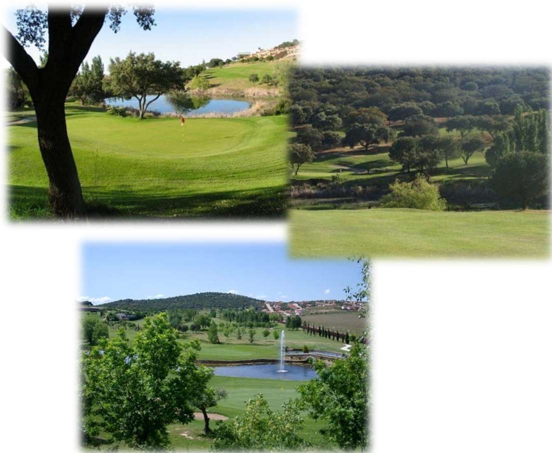
Instalaciones de Norba Club de Golf

Este año, la cercanía con nuestros vecinos Portugueses, hará que se cursen invitaciones a todos los ingenieros de Portugal que amen este deporte y deseen pasar un fin de semana en buena compañía y en un entorno que hará las delicias de los asistentes.